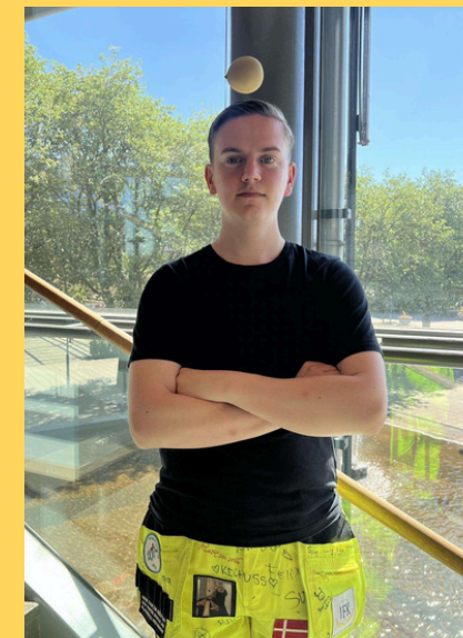
Oscar Thorsen General