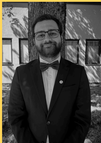
Yad Yassin Utbildningsansvarig